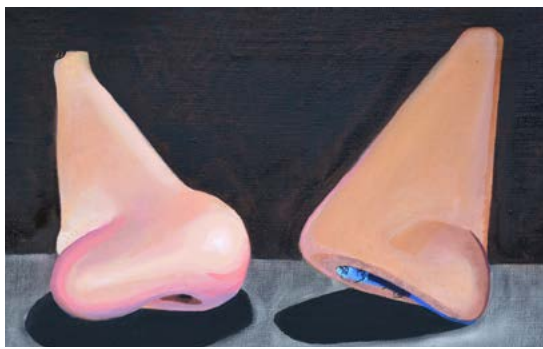
Liebe in Zeiten der Epidemie.