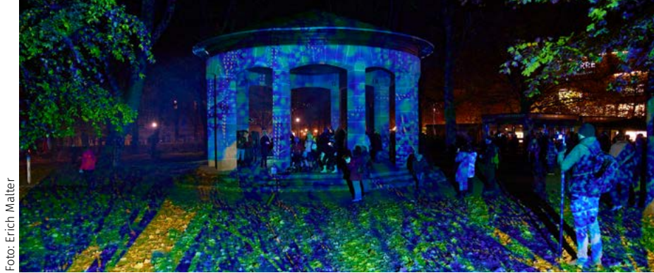
Am Samstag, 16. November, leuchtet die Kleeblattstadt wieder an mehreren Orten in den schillerndsten Farben.

sundheitsförderung unter der Rufnummer 974-1906 oder per Mail an sportinklusive@fuerth.de .