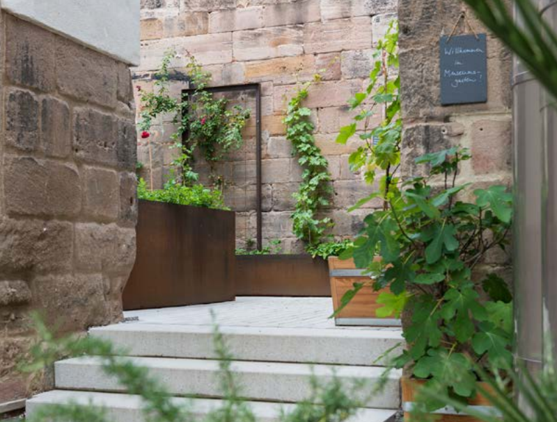
Der Alfred-Heilbronn-Museumsgarten im JMF Fürth.