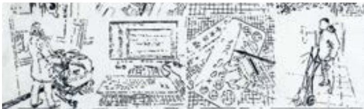
Gebäudewirtschaft, gesehen von Thomas Mohi (Ausschnitt)