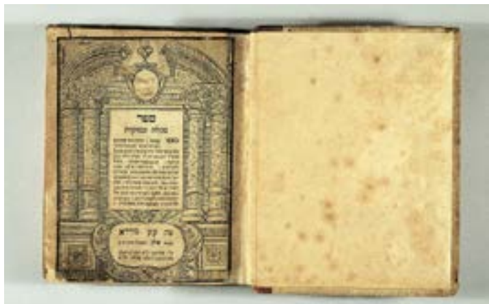
Erstes Druckwerk der Familie Fromm.

Was steht eigentlich in der Tora? Wo rüber schrieb der Fürther Erfolgsautor Jakob Wassermann? Was erzählen uns persönliche Briefe eines jüdisch-christlichen Paares aus der NS-Zeit? Die literarische Wandelführung im Rahmen des LESEN!-Festivals eröffnet spannende Einblicke in ganz unterschiedliche Texte und Genres. Im Jüdischen Museum Franken begeben sich die Teilnehmenden am Sonntag, 30. Juni, 14 Uhr, und Freitag, 5. Juli, 15.30 Uhr , auf eine literarische Reise durch die jüdische Geschichte. Der Eintritt beträgt acht Euro,