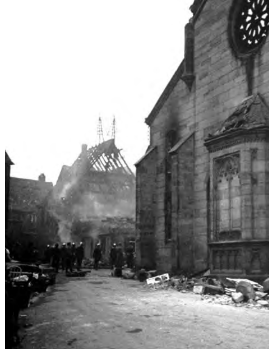
In der Reichspogromnacht zerstörten die Nationalsozialisten auch die Synagoge in der Geleitgasse.

Alle Bürgerinnen und Bürger sind zu dieser Gedenkfeier herzlich eingeladen. ●