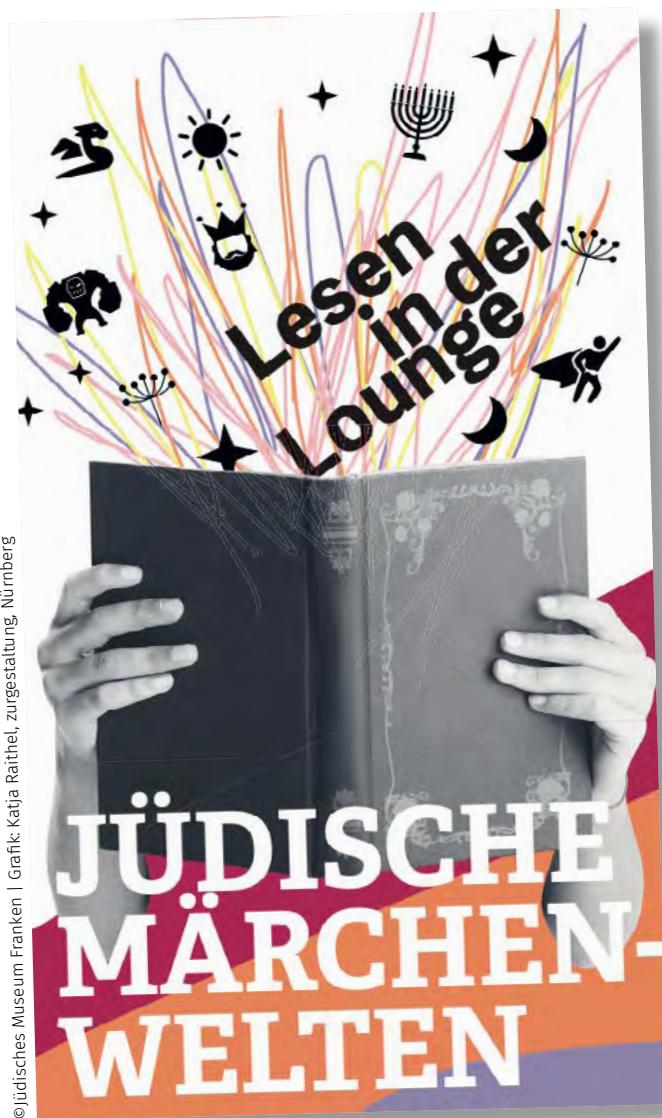
Grafik: Katja Raithel, Zuregestaltung, Nürnberg