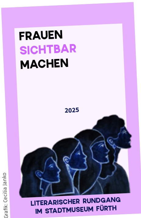
Grafik: Cecilia Jancko

Männer dominieren die Geschichtsbücher und Museen. Wo bleiben die Frauen? Wie haben sie gelebt? Was haben sie geleistet? Worauf mussten sie verzichten?