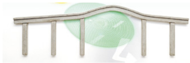
Tiefbauamt, gesehen von Franz Janetzko (Ausschnitt)