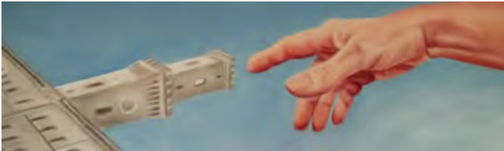
Grünflächenamt, gesehen von Ingrid Riedl (Ausschnitt)