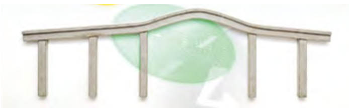
Tiefbauamt, gesehen von Franz Janetzko (Ausschnitt)