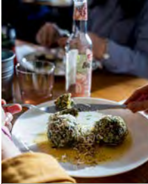
Stadtparkcafe Engelhardtstr. 20 stadtparkcafe.de