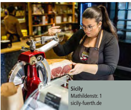
Sicily Mathildenstr. 1 sicily-fuerth.de