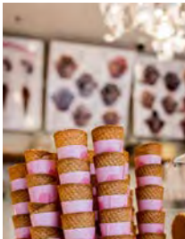
Eismania Rudolf-Breitscheid-Str. 9 Fürther Freiheit 12 eismania-fuerth.eatbu.com