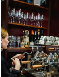
König Lotte Helmstraße 2 koeniglottefuerth.com

Entdecke Fürther Geschäfte auf Instagram @geheimtipp_fuerth