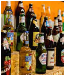
Bierothek Fürth Gustav-Schickedanz-Str. 8 bierothek.de/stores/fuerth