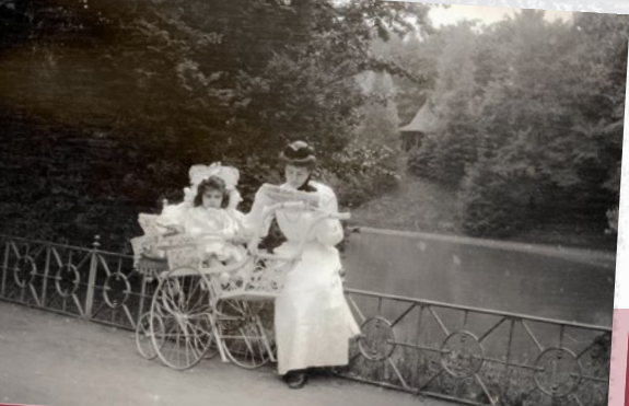
Pause am Schwanenweiher im Stadtpark