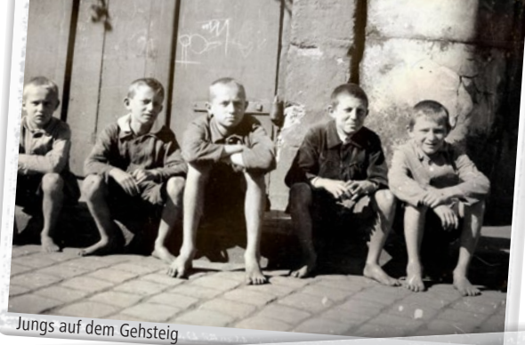
Jungs auf dem Gehsteig

Der Fokus der Ausstellung liegt nicht auf den baulichen Veränderungen im Stadtbild, sondern stellt die Menschen ins Zentrum, die Lotter auf seinen vielen Streifzügen durch die Kleeblattstadt begegnet sind: zum Beispiel Straßenhändler, Verkäufer, Stadtpolizisten, Militärpersonen, Marktleute, Handwerker, Erwachsene, Jugendliche, Straßen- und Schulkinder. Außerdem hält er verschiedenste Freizeitvergügungen der damaligen Zeit mit der Kamera fest. Lotters Aufnahmen wirken natürlich, häufig wie zufällige Schnapsschüsse, die gekonnt die Stimmungen der Menschen einfangen. Er bildet die vielfältige Stadtgesellschaft ab und klammert keine sozialen Schichten aus.