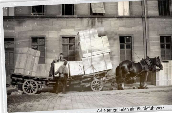
Arbeiter entladen ein Pferdefuhrwerk